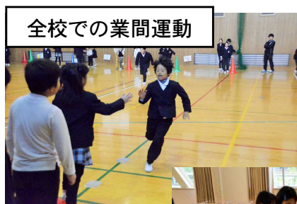
全校での業間運動