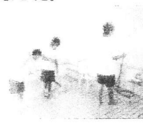
福祉センター訪問