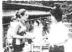
職業体験(高野山の案内)

職業体験、福祉センター訪問においても、様々な方々のお力添えをいただき実施することができました。子どもたちにとっては本当によい経験ができました。