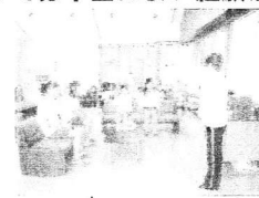
福祉センター訪問