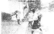
おはようございます。